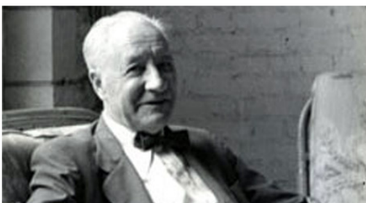
วิลเลียม เฟเธอร์ (William A. Feather)

“หนึ่งในสิ่งที่น่าสนใจในตลาดหุ้นก็คือทุกวันที่จะมีใครคนหนึ่งซื้อ ขณะที่อีกคนขาย แต่ทั้งคู่ต่างเชื่อว่าตนเองเฉียบแหลมกว่า”